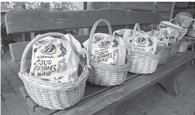
Die Naturpark-Vespertouren verbinden regionalen Genuss und Naturerlebnis.

Südschwarzwald – Doppeltes Vergnügen versprechen die diesjährigen Naturpark-Vespertouren, die 2022 wieder im Naturpark Südschwarzwald angeboten werden. Das Projekt vereint die Freuden einer Wanderung oder Radtour im vielgestaltigen Südschwarzwald mit dem Genuss regionaler Köstlichkeiten. Am Sonntag, den 3. Juli werden erneut einige Höfe im Naturpark Südschwarzwald leckere